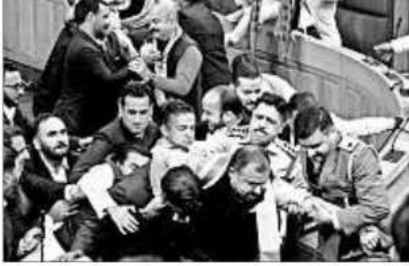
विधानसभा में हंगामा करते विधायक।

मुख्यमंत्री उमर अब्दुल्ला ने विधानसभा में उपराज्यपाल के अधिभाषण पर धन्यवाद प्रस्ताव पेश किए जाने के दौरान कहा कि जब वह पिछली बार सदन में बोले थे, तब जम्मू-कश्मीर एक राज्य था और देश में इसका विशेष स्थान एवं दर्जा था। मगर, यह सब अब खो गया है। अनुच्छेद 370 के तहत दिया गया विशेष दर्जा पांच अगस्त 2019 को समाप्त कर दिया गया था और पूर्ववर्ती राज्य को दो केंद्रशासित प्रदेशों जम्मू-कश्मीर और लद्दाख में विभाजित कर दिया गया था। मुख्यमंत्री ने कहा, मुझे सदन में इस तरह बोलने का मौका