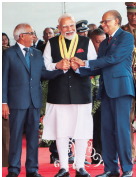
PM Narendra Modi with his Mauritius counterpart Navin Ramgoolam (left) and Mauritius President Dharam Gokhool, after receiving the highest national award of Mauritius — the Grand Commander of the Order of the Star and Key of the Indian Ocean — in Port Louis on Thursday

PRESS TRUST OF INDIA Port Louis, 12 March